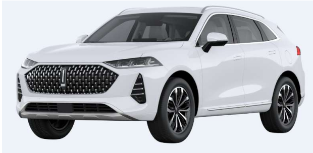
Snow White (Metallic)