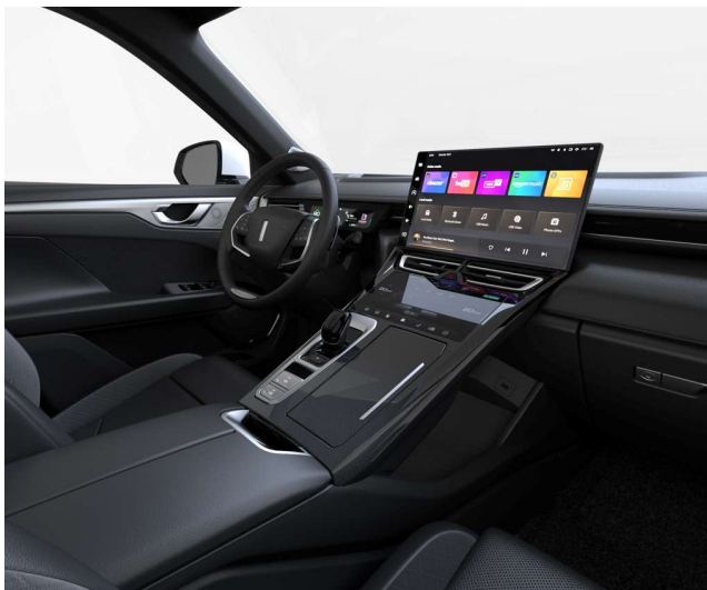
Black serienmäßig für Premium und Luxury