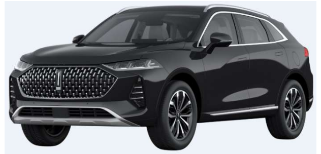
Lava Black (Metallic)