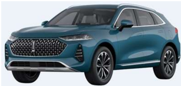
Deep Sea Blue (Metallic)