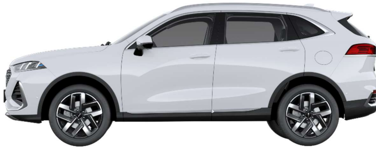
Snow White (Metallic)