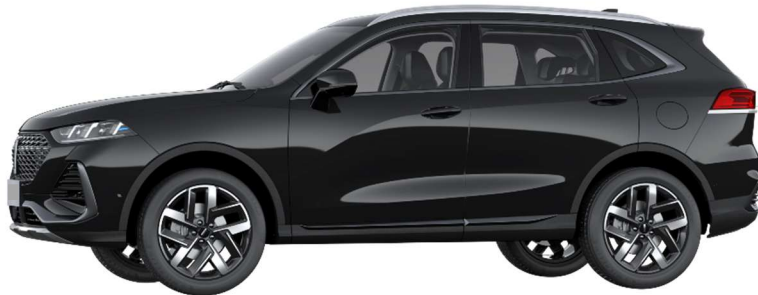
Lava Black (Metallic)