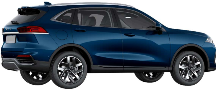
Deep Sea Blue (Metallic)